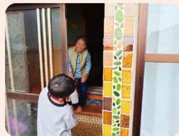
地域の方の協力も得ながら鉢花と笑顔を届けました。

足摺岬小学校や三崎小学校でも自分たちで植え育てた鉢花を、校区のお年寄りや区長場などに配っています。