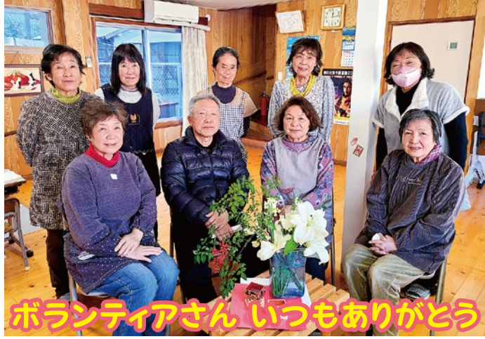
ボランティアさん いつもありがとう

窪津ツバキ会は、窪津区長場にて毎月第2木曜日に開催しています。今年で8年目を迎える9名のボランティアさんは、サロン参加を通じて仲の良さ・チームワークと信頼関係を築いてきました。2班に分かれ、月交代で食事の準備を行うなど、上手に役割分担してサロンを運営しています。毎回、食事のテーブルには季節の花を飾り、参加者の楽しみの一つになっています。この日も参加者が花をもらって「帰って自宅に花を飾るのが楽しみ!」と笑顔で話してくれました。