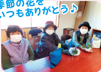
季節の花を いつもありがとう♪

ボランティアのみなさん、これからもサロンが地域の集いの場として継続していけるよう、よろしくお祈りします!!