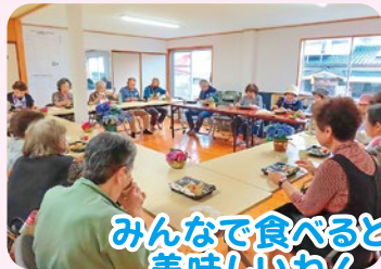
みんなで食べると 美味しいね!