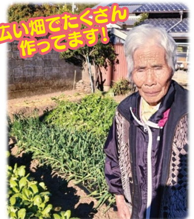
広い畑でたくさん 作ってます!

畑で野菜を育てることと、サロンで顔なじみの人に出たりするのが何よりの楽しみだそうです。これからも末永くお元気でいて下さいね。